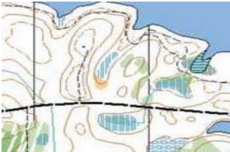
Kortudsnit fra Tokkekøb Hegn